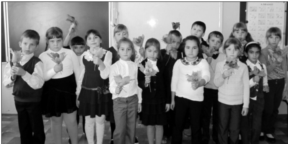
Победители выставки декоративно-прикладного творчества.

Великий педагог В.А. Сухомлинский говорил, что «важнейшая задача эстетического воспитания - научить видеть в красоте окружающего мира духовное благородство, доброту, сердечность и на основе этого утверждать прекрасное в самом себе». Эти слова актуальны и сегодня. И в настоящее время народное искусство широко применяется в художественном воспитании детей. Ознакомление с произведениями народного творчества способствует воспитанию у детей патриотических чувств, приобщает к миру прекрасного, формирует у школьников художественный вкус,