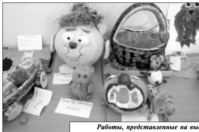
Работы, представленные на выставке «Урожай-2016».