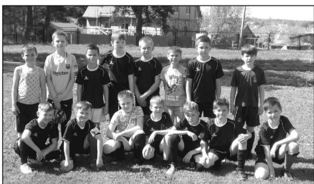
Команда юных спортсменов Износковского района.