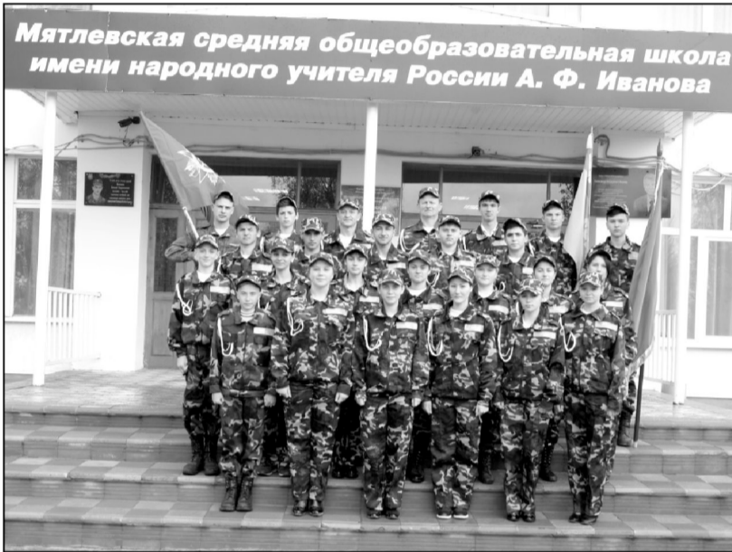
Мятлевская средняя общеобразовательная школа имени народного учителя России А. Ф. Иванова