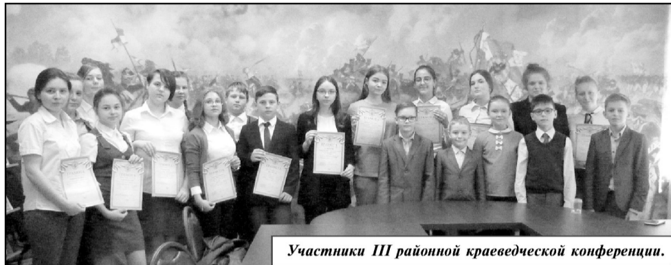
Участники III районной краеведческой конференции.

Кто больше всего знает об истории, традициях, загадках, легендах, происхождении того или иного в регионе, городе, поселении или маленькой деревне? Конечно же, те, кто этим всерьез интересуется. Историки, археологи и палеонтологи, архивисты, этнографы и филологи, искусствоведы и писатели - словом, исследователи. Каждая из вышеперечисленных наук и многие другие в той или иной степени соприкасаются с большой кропотливой работой, благодаря которой мы с вами узнаем больше о своей родине, национальной культуре, искусстве, становимся духовно богаче и сильнее.