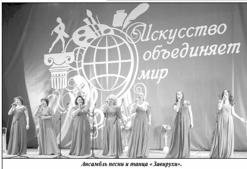
Ансамбль песни и танца «Завирухи».

ники, концерты, разнообразные мероприятия для детей и молодежи, массовые народные гуляния, творческие вечера, конкурсы и фестивали. Помогают раскрыться талантам и реализовываться способностям.