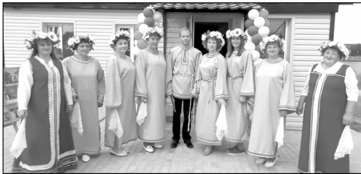
Самодельный ансамбль «Околица» Извольского сельского Дома культуры.

Благодаря идеям и кропотливому труду сотрудников библиотек сельчане живут интересной, насыщенной новыми знаниями жизнью. С читателем работают как офлайн, так и онлайн. Проводят презентации и флешмобы, виртуальные выставки и журналы, видеофиль-