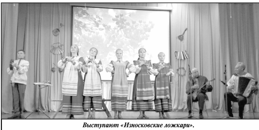
Выступают «Износковские ложки».

Работники двух культурно-спортивных центров и шести сельских Домов культуры района дарят землякам яркие празд-