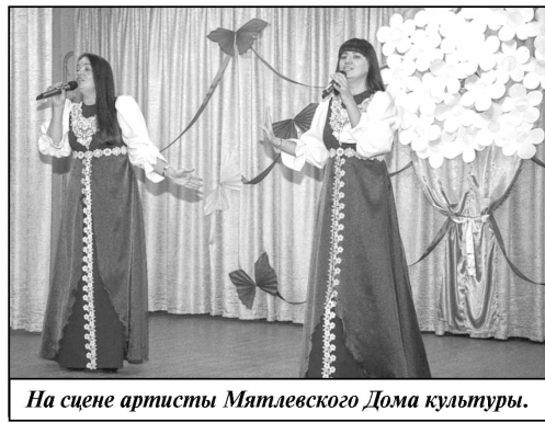
На сцене артисты Мятлевского Дома культуры.

Детские творческие коллективы школы искусств регулярно принимают участие в международных, всероссийских, областных конкурсах и фестивалях и неизменно занимают призовые места, ежегодно самые одаренные дети награждаются стипендия-