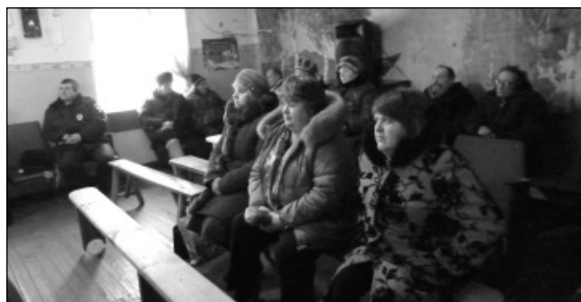
Местные жители не пришли слушать отчет главы администрации МО СП «Село Извольск», зал был полупустым.