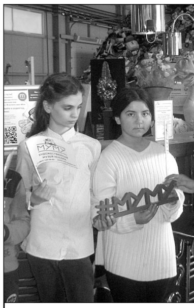
В музее мусора «МУ МУ».

Награды призеры получили в торжественной обстановке, из рук организаторов проекта и представителей Автономной некоммерческой организации «Экологическая и патриотическая инициатива». В этот ответственный и торжественный момент каждый из школьников чувствовал себя особенным – свой, пусть пока не большой, вклад в сохранение окружающей среды они уже внесли. В сознании участников награждения навсегда поселилась и укрепилась добрая мысль – сохраняй природу! Работы победителей были представлены тут же, и каждый смог найти свой рисунок и представить его лично.