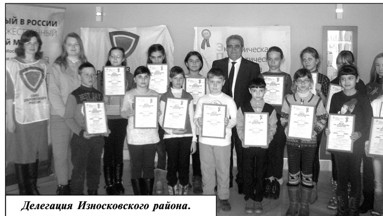
Делегация Износковского района.

ны, как правило, из старых запчастей авто.