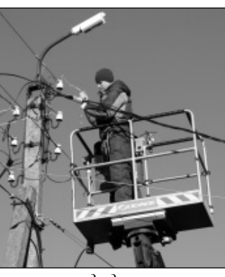
Установка светодиодного светильника.

За окном зима, а это значит, что на работу мы уходим, когда ещё темно, а возвращаемся, когда уже темно. Сегодня, когда новые светодиодные светильники освещают улицы нашего районного центра, жители села Износки в полной мере смогли ощутить всю прелесть этого яркого, недорогого и такого нужного света. Казалось бы, что остается только радоваться, но удивляет, что и сейчас, когда, наконец, вопрос решён, в селе Износки остаются люди, которые предъявляют претензии к администрации района по причине того, что теперь на улицах, где были установлены новые све-