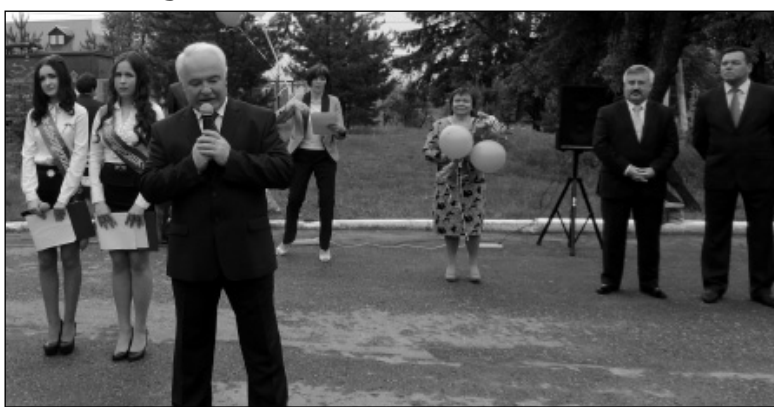
Поздравление главы администрации МР «Износковский район» В.В. Леонова.