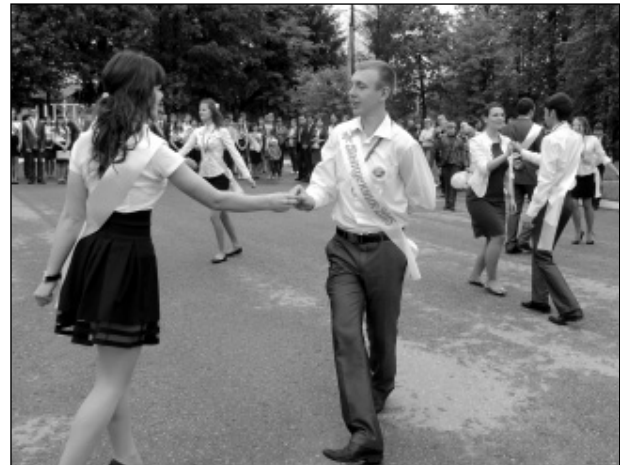
Закружились в вальсе выпускники...