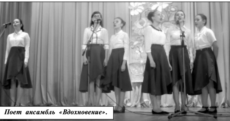
Поет ансамбль «Вдохновение».

Да, выпускники ДШИ, как точно подметил В.В. Леонов, действительно получили своеобразный пропуск в мировую и отечественную культуру. А вот как они им воспользуются - предпочтут ли ее высокие образцы или прельстятся облегченным вариантом культуры массовой, покажет время. Поживем - увидим. Л. ЛИХОВИДОВА.