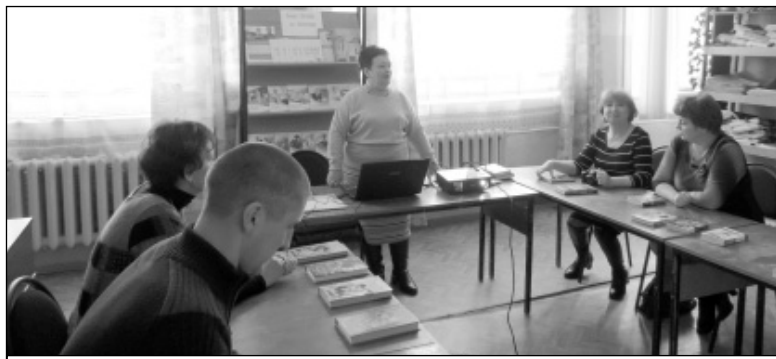
Открытие Года литературы в Износковской библиотеке.

У казом Президента РФ 2015 год объявлен Годом литературы. Литература расширяет духовный кругозор человека, помогает находить ответы на многие вопросы, вести к духовному подъему. Значение ее трудно оценить. Литература стремится изведать жизнь и на практике, приложить и проверить истины, привитые общему сознанию. Литература дает колоссальный, обширнейший, глубочайший опыт жизни. Она делает человека интеллигентным, развивает в нем не только чувство красоты, но и понимание жизни, всех ее сложностей, служит проводником в другие эпохи и к другим народам, раскрывает перед нами сердца людей. Одним словом, делает человека мудрым. Но все это дается только тогда, когда человек читает, вникая во все мелочи.