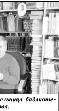
Лучшая читательница библиотеки В.И. Жаркова.

У каждого человека есть любимые произведения, к которым он обращается неоднократно, которые знает в деталях, о которых может на-