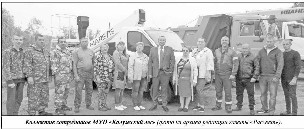
Коллектив сотрудников МУП «Калужский лес».