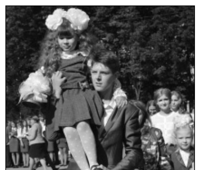
Звонит первый звонок нового учебного года.