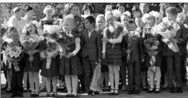
В центре внимания - первоклассники и одиннадцатиклассники.