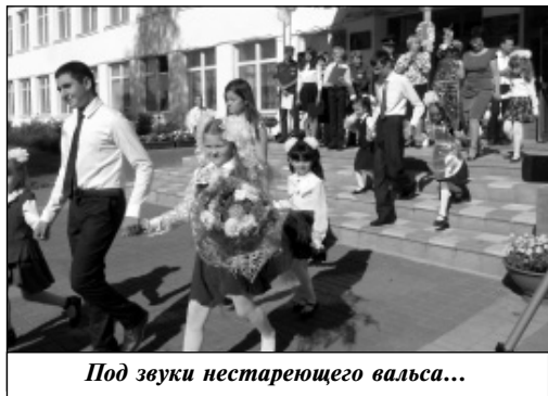
Под звуки нестарящего вальса...

Первое сентября считается особым днём. Этот праздник самый долгожданный для тех, кто переступил впервые школьный порог. В День знаний даже погода решила сделать подарок ученикам Мятлевской средней общеобразовательной школы им. А.Ф. Иванова, собравшимся на школьной парадной площади. Ласковое солнце и легкий ветерок, сияющее, с разбросанными забавными тучками-улыбками, голубое небо приветливо встречали нарядных ребят. Во всем чувствовалось праздничное настроение. Какой же красотой восхитил всех присутствующих школьный декоративно-цветочный парк! Особенно выражали свой восторг родители «новеньких» учеников и гости, впервые пришедшие в школу. Море цветов смешалось с морем улыбок, которые дарил друг другу ученики, учителя и родители, как добрые друзья, встретившиеся после разлуки.