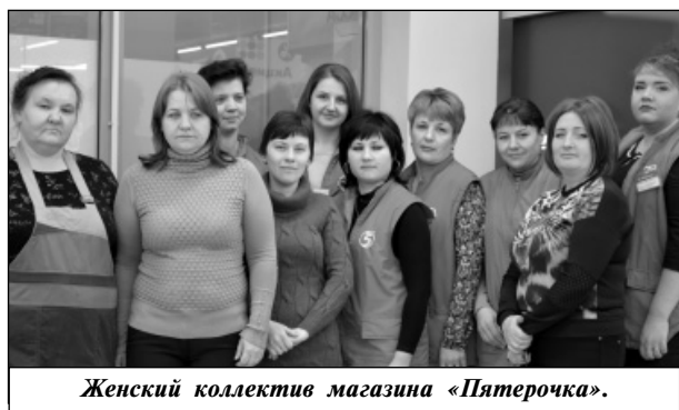
Женский коллектив магазина «Пятерочка».

Совсем недавно, в августе 2015 года, открылся в нашем районном центре магазин «Пятерочка». Несмотря на «молодой» возраст, он снискал любовь у многих жителей района, поскольку ориентирован на низкий ценовой сегмент,