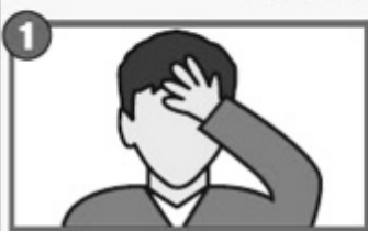
1 Внезапная слабость, онемение в руке или ноге