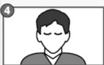
4 Обморок, потеря сознания