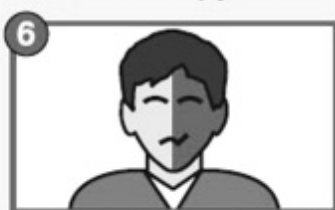
6 Онемение губы, половины лица, перекос лица

Этот метод эффективен для профилактики как ишемического, так и геморрагического инсульта, потому что в результате длительной артериальной гипертензии происходит перестройка стенки артерий, в которых могут образовываться микроаневризмы.