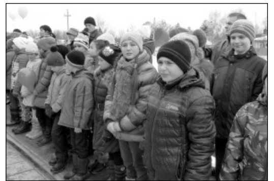
На торжественной церемонии. Дети - будущее посёлка.

Почетное право открытия железнодорожного модульного зала