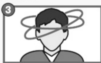
3 Потеря равновесия, нарушение координации, головокружение