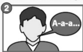
2 Нарушение речи или её понимания