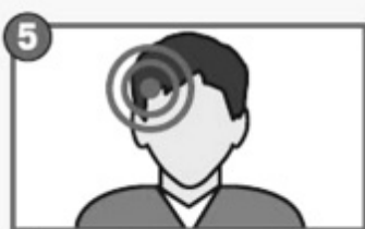
5 Резкая головная боль