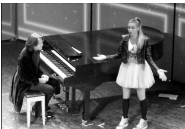
Фрагмент музыкально-просветительского проекта «Перевернуть игру».

7 ноября учащиеся МОУ «Мятлевская СОШ им. А.Ф. Иванова» посетили Калужский областной драматический театр. В этот день на сцене театра один из самых популярных российских музыкантов - народный артист России Дмитрий Маликов представил музыкально-просветительский проект «Перевернуть игру», где выступил автором идеи, продюсером, актером и пианистом. В основе спектакля - разговор двух поколений. У каждого - своя правда. В данном случае - музыкальные пристрастия. Дальше на сцене стали происходить настоящие чудеса, то и дело погружающие публику в атмосферу самых разных эпох и переносящие из одной страны в другую. Здесь можно было буквально прожить целый день вместе с Моцартом, увидеть мир глазами Майкла Джексона, понять несправедливость времени по отношению к Баху, прочувствовать невосполнимую утрату слуха великим композитором Бетховеном, восхититься и вдохновиться патриотизмом Рахманинова и силой духа Галины Вишневской. Разные исторические эпохи, разные человеческие характеры, разные музыкальные направления: классика, джаз, блюз, рок-н-ролл и поп-музыка.