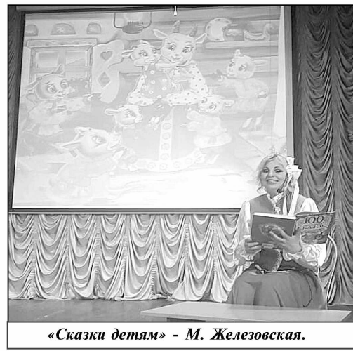
«Сказки детям» - М. Железовская.