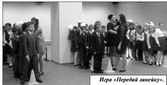
Игра «Передай линейку».