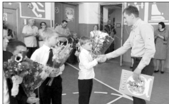
Книга - лучший подарок первокласснику.

дил в рамках Всероссийского форума профессиональной навигации «ПроеКТОриЯ». Праздник 1 сентября всегда остается незабываемым, радостным и волнующим. Хочется пожелать всем, чтобы стремление двигаться вперед и расти никогда не иссякало, чтобы полученные знания были направлены на достижение личного благополучия, а значит, и на развитие родного села и родной страны. Успеха и удачи во всех начинаниях!