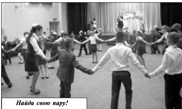
Найди свою пару!

калку, и это еще больше сплотило ребят. Задание выполнили на отлично. Ребятам некогда было отдыхать, так как уже паровозиком по классам и в движении исполняли детские песенки в конкурсе «Едем и поем, очень дружно мы живем». Подвижные игры «Собери портфель»,