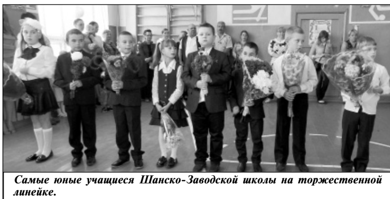
Самые юные учащиеся Шанско-Заводской школы на торжественной линейке.