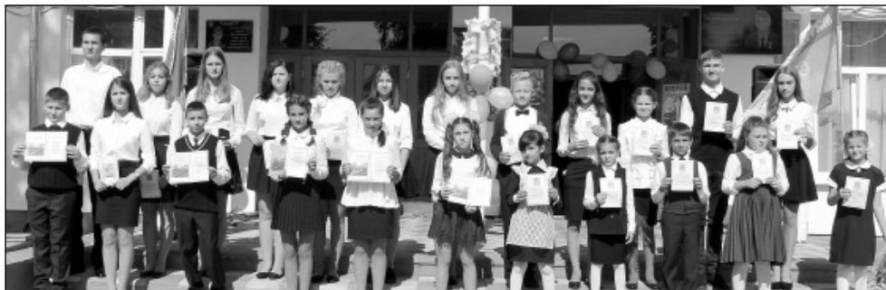
Лучшие ученики Мятлевской школы, получившие свидетельства о занесении на школьную Доску почета.