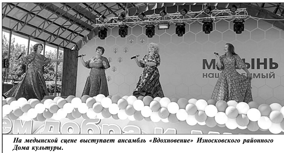
На медынской сцене выступает ансамбль «Вдохновение» Износковского районного Дома культуры.