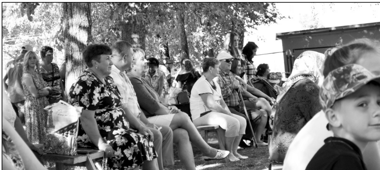
Зрителей было немало, этот праздник в Хвощах любят.

Начало праздника было положено соревнованиями по футболу между командами из д. Хвощи и с. Износки. Участники очередного футбольного матча по-