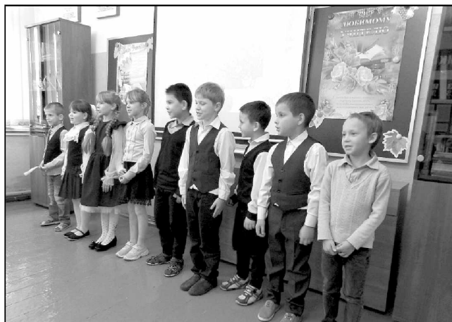
В концертной программе для любимых учителей принимали участие как старшеклассники, так и самые маленькие воспитанники школы.

Учительская профессия по природе своей достаточно гуманна. И пусть праздник проходит, но любовь и всенародное