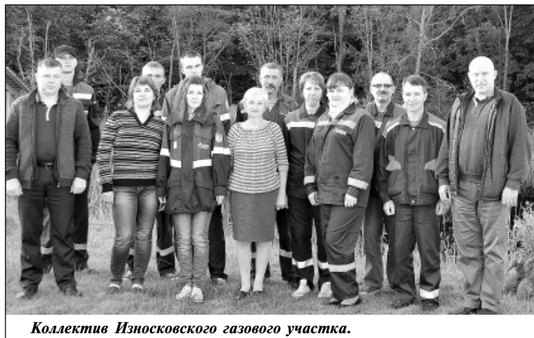
Коллектив Износковского газового участка.