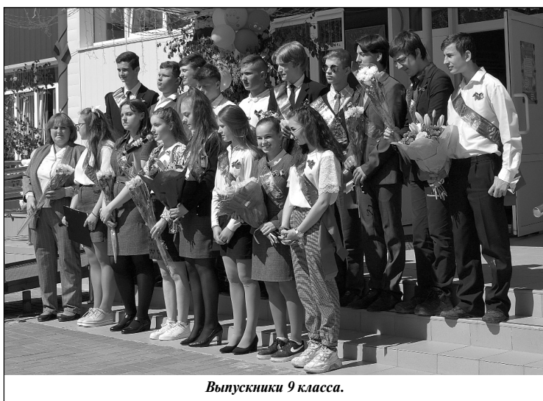
Выпускники 9 класса.

И, конечно же, напутствие и поздравления ребят, с некоторой завистью смотрящих на выпускников, кажущихся им такими взрослыми и самостоятельными.