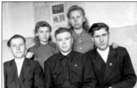
Износковский РК ВЛКСМ в послевоенные годы.