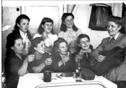
1948 год. Деревня Алешня. Встреча девушек, вернувшихся из эвакуации.