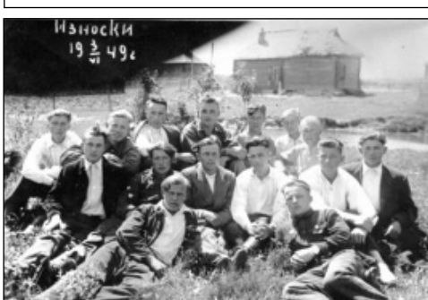
Работники районной кинесети, 1949 г.