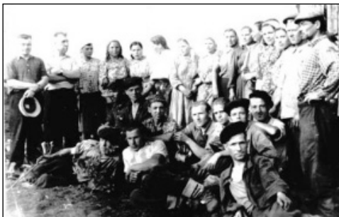
Работники торфопредприятия после войны.