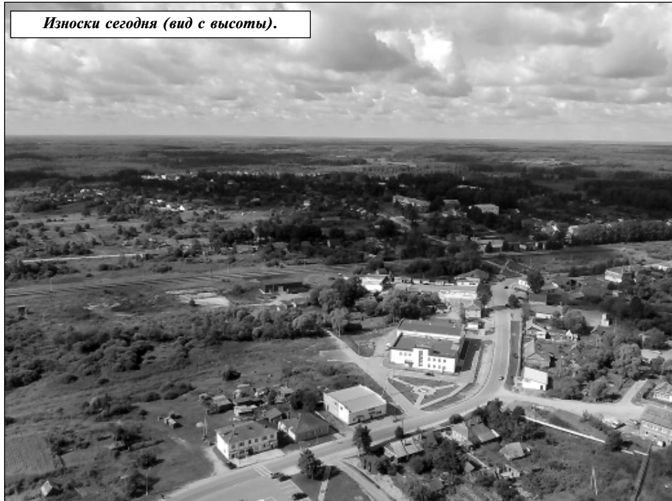
Износки сегодня (вид с высоты).

Репортажи о праздновании Дня поселка Мятлево и Дня района читайте в ближайших номерах газеты «Рассвет».