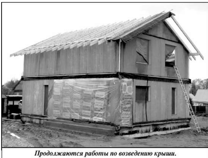
Продолжаются работы по возведению крыши.