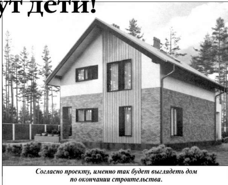
Согласно проекту, именно так будет выглядеть дом по окончании строительства.