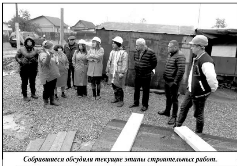
Собравшиеся обсудили текущие этапы строительных работ.

дратных метров подрядная организация ООО «ТАТРА» приступила в сентябре этого года. На сегодняшний день здесь возводят двухэтажную крышу. Современная планировка фасада и внутренних помещений уже сейчас обращает на себя внимание своей оригинальностью. К границам земельного участка, где ведется строительство, подведены необходимые коммуникации: газ, вода, здесь установлен электрический счетчик.