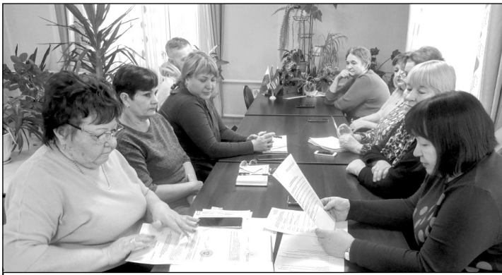
Совместное заседание общественного совета и общественной комиссии.