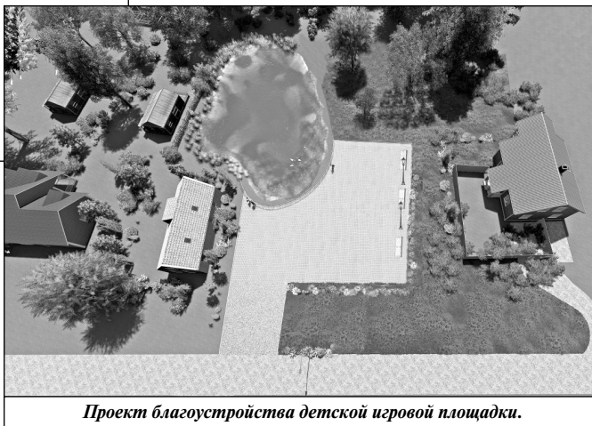
Проект благоустройства детской игровой площадки.

Обсудив все предложения, участники заседания решили включить следующие объекты при проведении Всероссийского онлайн голосования по отбору общественной территории, подлежащей благоустройству в первоочередном порядке в 2025 году в рамках реализации