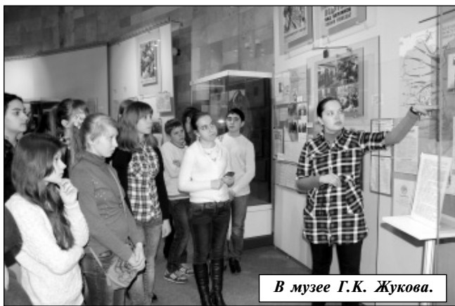
В музее Г.К. Жукова.

Выйдя из музея, мы еще некоторое время делились впечатлениями и осматривали здание музея. Но путеше-