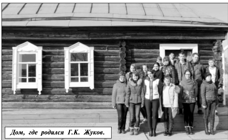
Дом, где родился Г.К. Жуков.

Константиновича, с мемориальной коллекцией личных вещей, фотографий, документов. Впечатлил зал Победы, посвященный послевоенному периоду жизни Г.К. Жукова. Мы долго стояли перед витриной, в которой располагается парадный китель маршала со всеми его многочисленными наградами. Закончи-