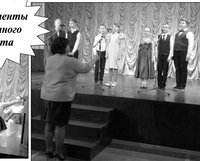
Фотомоменты праздничного концерта