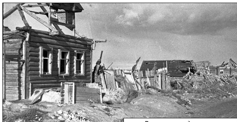
Вот так выглядели улицы поселка Мятлево сразу после его освобождения.

И все же скрытое сопротивление было. Люди как могли прятали продукты питания, невероятным образом им удавалось узнавать новости о положении дел на фронте, в частности, по воспоминаниям свидетелей тех дней, всех вдохно-