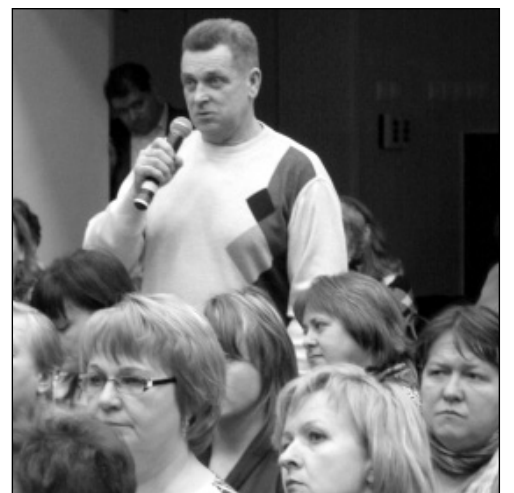
Вопросы из зала.