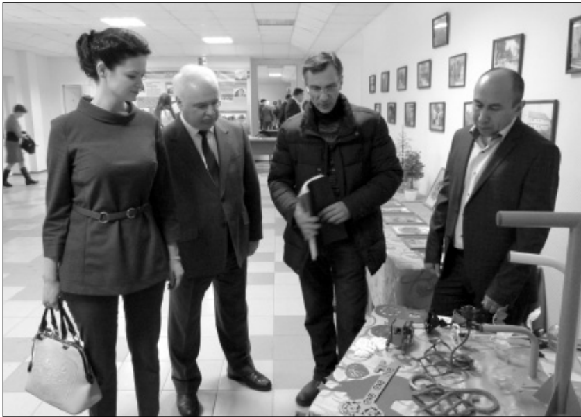
В фойе КСЦ «Олимп» была организована выставка продукции малых предприятий, расположенных на территории Износковского района.

В фойе «Олимпа» в день отчётного собрания была организована выставка продукции предприятий малого бизнеса,