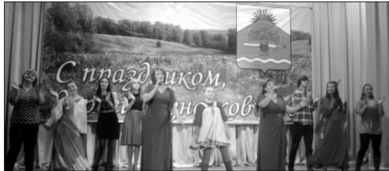
Фрагмент праздничного концерта в КСЦ «Олимп».

щихся Износковской средней школы провела информационный час «Бессмертен тот, Отечество кто спас», где шел разговор о Смутном Времени, о героях, возглавивших народное ополчение, К. Минине и Д. Пожарском.