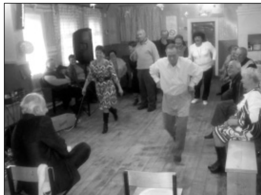
Праздничное веселье в самом разгаре.