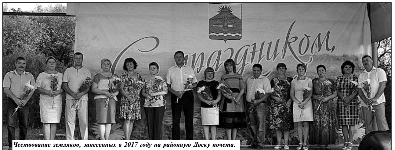
Чествование земляков, занесенных в 2017 году на районную Доску почета.