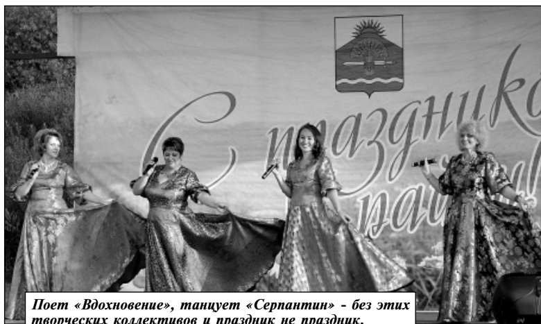
Поет «Вдохновение», танцует «Серпантин» - без этих творческих коллективов и праздник не праздник.