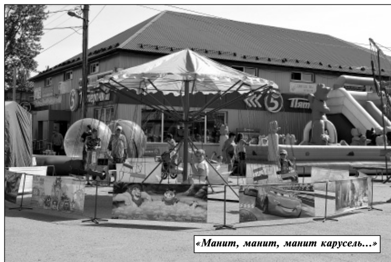
«Манит, манит, манит карусель...»

Сумерки наступили быстро. К вечеру людей на площади стало больше, и они все подходили и подходили. Да и погода не подвела, пос-