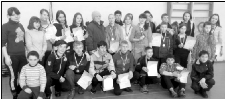
Снимок на память: все участники районных соревнований.