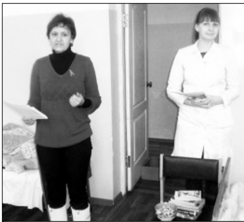
На дне больного в Износковской ЦРБ.

держатся в сигарете. Никотин обладает свойством сужать сосуды, а при постоянном употреблении табака сосуды находятся в спазмированном состоянии. Это приводит к постоянному повышенному артериальному давлению. Угарный газ, в свою очередь, приводит к кислородному голоданию. Связано это с тем, что окись углерода намного быстрее соединяется с гемоглобином, чем кислород, тем самым вытесняя его. Таким образом, к тканям и органам поступает кислорода в разы меньше, чем необходимо.