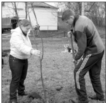
Рябинка, посаженная в 2010 г., хотела жить...

Знаете ли вы, что в этом году с. Износки исполняется 239 лет, и, может быть, чуть меньше железнодорожному скверу?.. Старожилы наверняка помнят, каким он был уютным и тенистым, хотя и без благоустроенных дорожек. Новые времена внесли корректировки в обустроенность сквера. И вот уже нет там тех раскидистых ив... А что есть? Задумывался он как рябиновый, да вот только рябины никак здесь не приживутся. То косцы летом косами