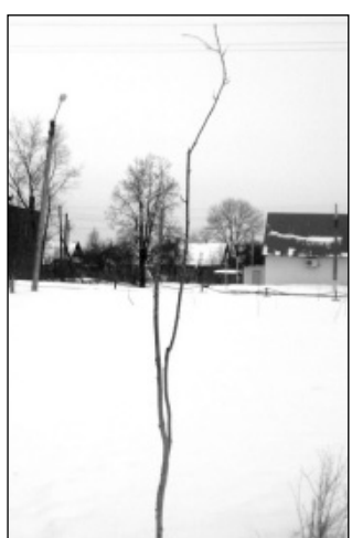
Эта же рябина сегодня.

новчан гораздо выше нашей, что живут там именно патриоты края, а не Иваны, не