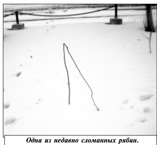
Одна из недавно сломанных рябин.

Понятно, что ломают деревья подростки и молодежь. Это и вызывает тревогу, поскольку является доказательством заболеваемости общества. Разве может быть здоровым человек, уничтожающий живую природу? Еще в советские времена существовал лозунг: «Бережь при-