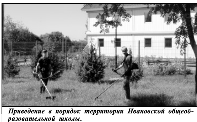
Приведение в порядок территории Ивановской общеобразовательной школы.