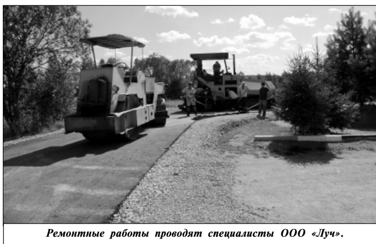
Ремонтные работы проводят специалисты ООО «Луч».