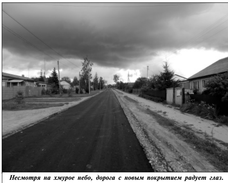
Несмотря на хмурое небо, дорога с новым покрытием радует глаз.

Ремонт дорог - дело не из дешевых, на это нужны деньги, и немалые, поэтому и ремонтируются дороги у нас планомерно, поэтапно, километр за километром. На сегодняшний день эта тема у нас в районе одна из приоритетных. Стоит отметить, что при составлении перспективного плана ремонта дорог районная власть всегда учитывает наказы местных жителей, по многочисленным просьбам которых, например, на