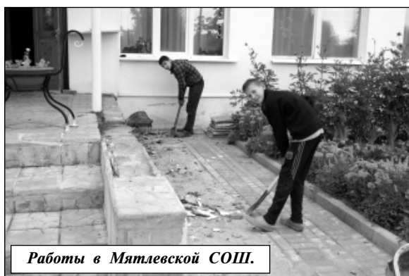
Работы в Мятлевской СОШ.

«Село Шанский Завод», администрация МО СП «Село Извольск». Для сравнения: за аналогичный период в 2014 году было трудоустроено 35 учащихся, ребята работали в МОУ «Износковская СОШ»; МОУ «Мятлевская СОШ им. А.Ф. Иванова»; МКОУ «ООШ» д. Ивановское; МКОУ «СОШ» д. Хвощи;