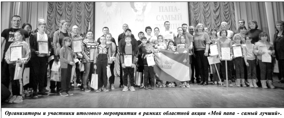
Организаторы и участники итогового мероприятия в рамках областной акции «Мой папа - самый лучший».

Завершилась встреча праздничным концертом, подготовленным работниками культуры. Для гостей были представлены веселые вокальные и танцевальные номера детского хореографического коллектива «Серпантин» и ансамбля песни и пляски «Завирухи», а также показательное выступление ребят из дружины юных пожарных «Радуга» Мятлевской средней школы.