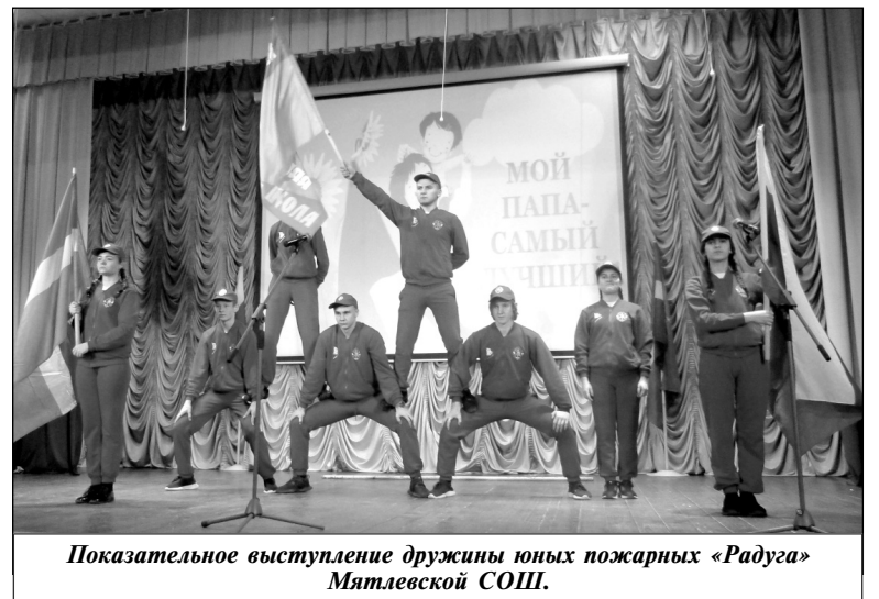
Показательное выступление дружины юных пожарных «Радуга» Мятлевской СОШ.

Почетную награду первому в Износковском районе вручили