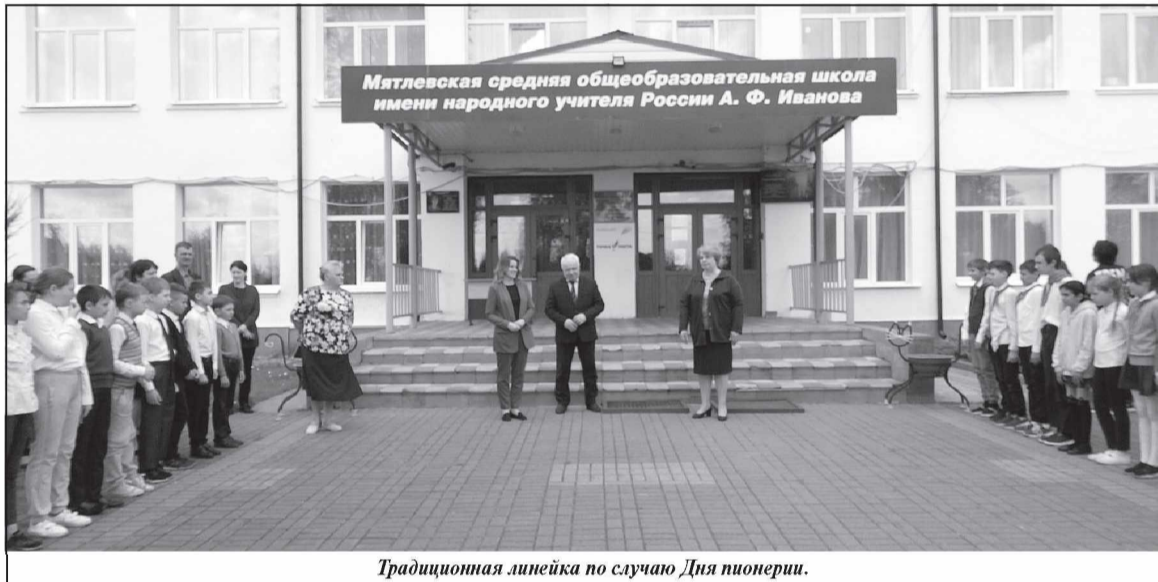
Традиционная линейка по случаю Дня пионерии.

Основной целью визита детско-го омбудсмена в учебное заведение было обсудить в преддверии