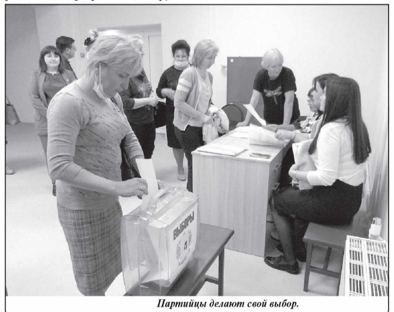
Партийцы делают свой выбор.