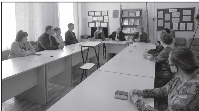
В Мятлевской средней общеобразовательной школе имени А.Ф. Иванова обсудили вопросы безопасности детей и подростков в летний период.

школьных каникул с учителями, у которых есть контакт и с детьми и с родителями, вопросы безопасности детей. Ведь только в таком взаимодействии, по ее мнению, можно получить должный эффект и результат. Поднимались проблемы противопожарной безопасно-