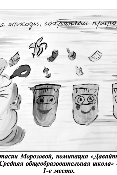
Сортируя отходы, сохраняем природу!

Всего в конкурсе свои таланты продемонстрировали 29 начинающих художников, которых волнуют вопросы бережного отношения к природе.