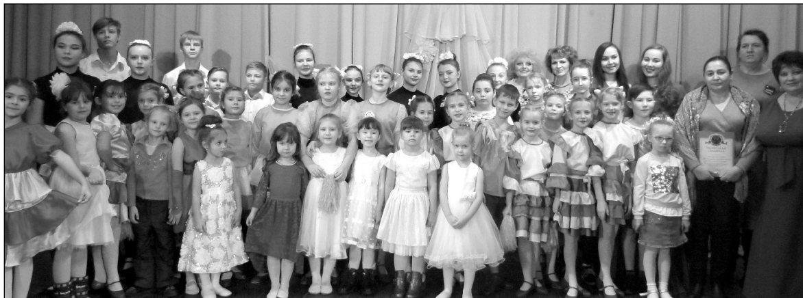
Все участники концерта, посвященного Дню матери.