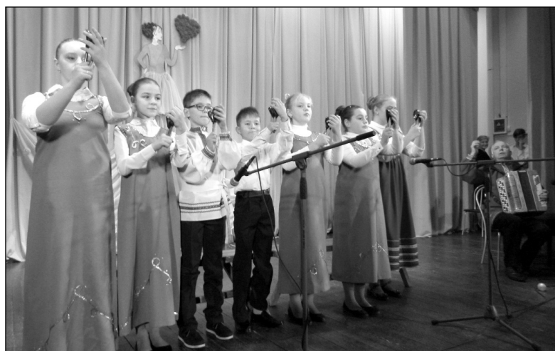
На сцене - знаменитые «Износковские ложки».