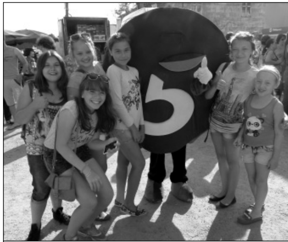
Фото на память с «Пятерочкой».