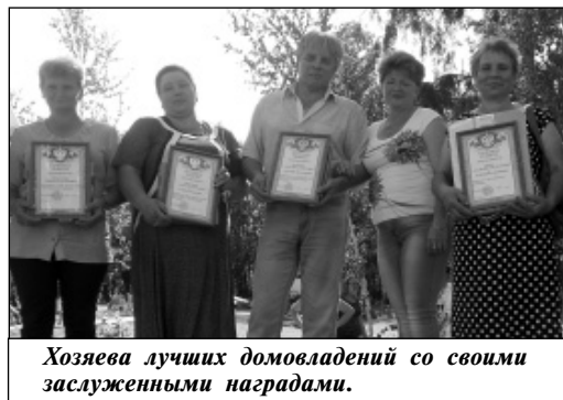
Хозяйка лучших домовладений со своими заслуженными наградами.