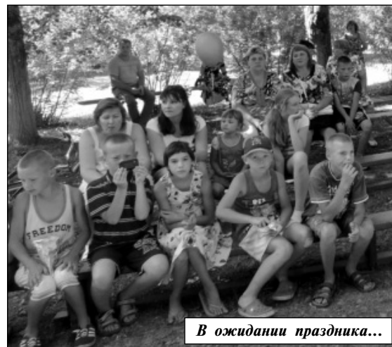
В ожидании праздника...

- А основы всему закладываются в семье, этой маленькой ячейке, благодаря которой когда-то и стало развиваться село. Семья - всему опора и основа, - с этих слов ведущей