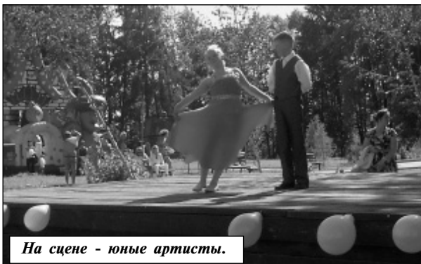
На сцене - юные артисты.

Районных наград были удостоены: работник муниципальной службы СП «Де-