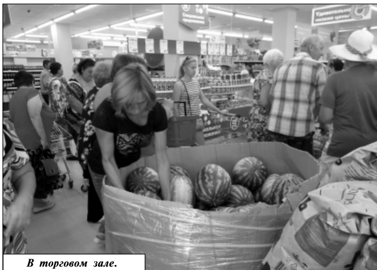
В торговом зале.

разилось до неузнаваемости. Просторный зал с новеньким торговым оборудованием, яркий свет неоновых ламп несколько ошеломили покупателей, рассматривавших ценники товаров. За небольшой промежуток времени у касс выстроилась довольно внушительная очередь с тележками и корзинами, наполненными продуктами. Но тем не менее кассиры, четко выполнявшие свои обязанности, быстро обслуживали клиентов.