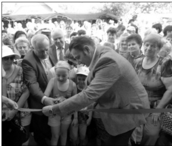
Символическое перерезание ленточки.

Привычное здание любимого многими магазина «Серёжка» после ремонта преоб-