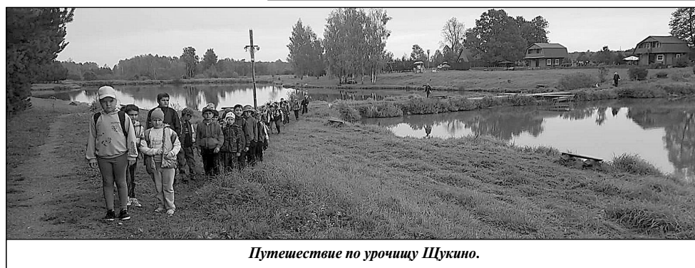
Путешествие по урочищу Шукино.