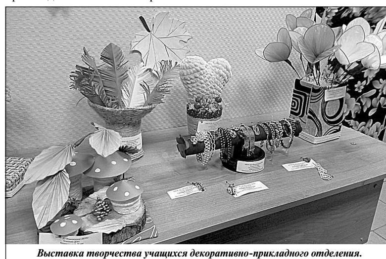
Выставка творчества учащихся декоративно-прикладного отделения.