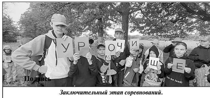
Заключительный этап соревнований.

Всем командам удалось успешно пройти интересную игру по станциям, после чего они получали буквы, из которых по оконча-