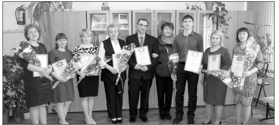
Участники районного конкурса «Я в педагогике нашел свое призвание» с заслуженными наградами.