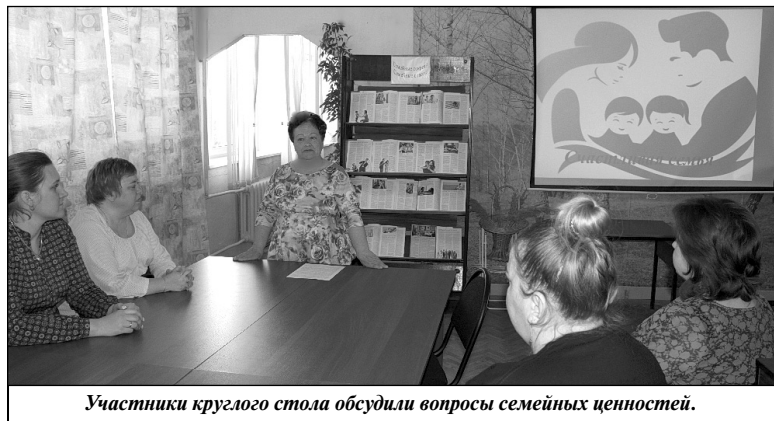
Участники круглого стола обсудили вопросы семейных ценностей.

Немало споров вызвал вопрос об успешности первых и последующих детей в семье. Обсудив все предложенные доводы и гипотезы, участники обсуждения пришли к выводу о том, что успешность ребенка зависит от общей атмосферы, царящей в семье, от существующего там морально-психологического климата, который становится для ребенка школой отношений с людьми. Именно в семье складываются представления о добре и зле, о порядочности, об уважительном отношении к материальным и духовным ценностям. Ребенок в семье получает азы знаний об окружающем мире. С близкими людьми он переживает чувства любви, дружбы, долга, ответственности, справедливости.