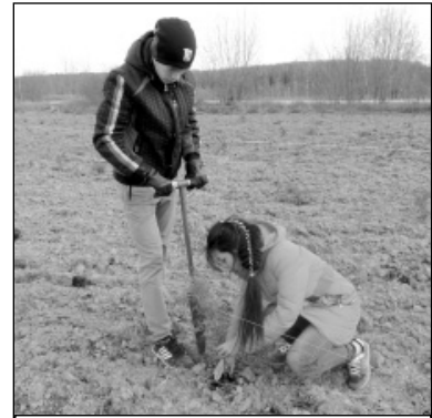
Высадка саженцев в питомнике.

Несмотря на неблагоприятный, пронизывающий ветер, работа спорилась. Молодежь в полной мере осознавала всю важность ответственной работы. Да и в самом деле, именно их имена будут занесены в летопись родного края как участников такого важного события в истории района. Все участники акции понимали, что дерево считается символом мира, служит напоминанием о хрупкости природы и необходимости ее защиты, а значит, и они внесли посильный вклад в нужное дело.