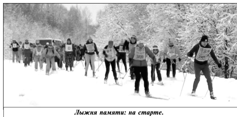
Лыжня памяти: на старте.