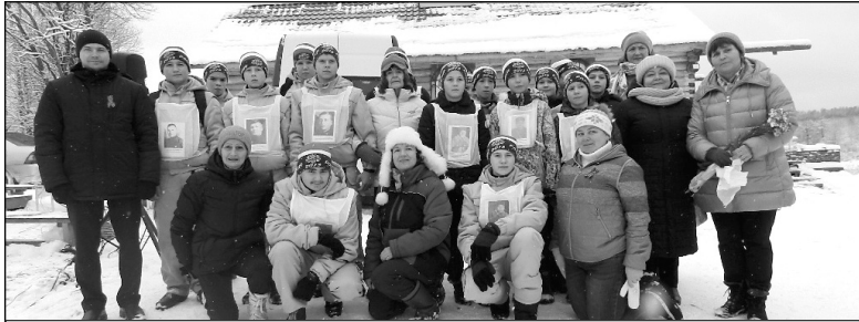
Команда Износковского района.