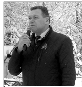
Выступление главы МР «Износковский район» П.И. Маркелова.