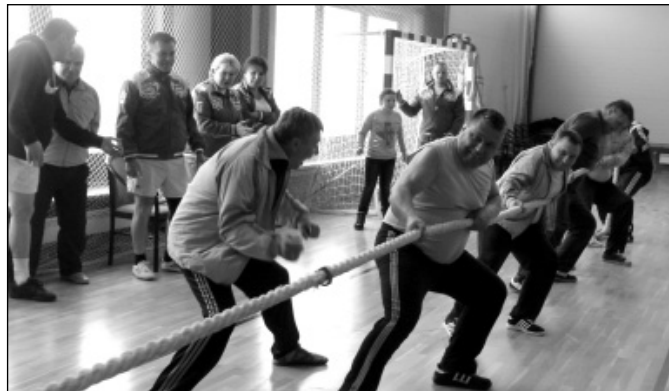
Перетягивание каната. На снимке: участники команды Износковского района в борьбе за победу.