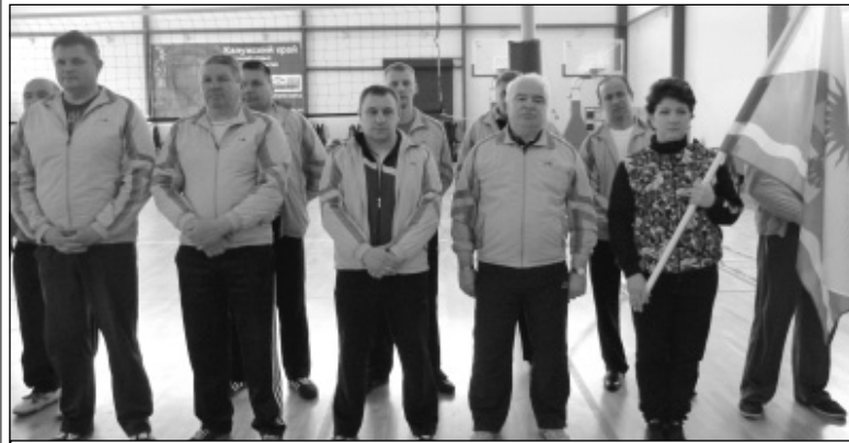
Спортивная команда Износковского района.

ялись здесь четыре года назад, инициатором их проведения тогда, как, впрочем, и в другие годы, стала администрация Износковского района.