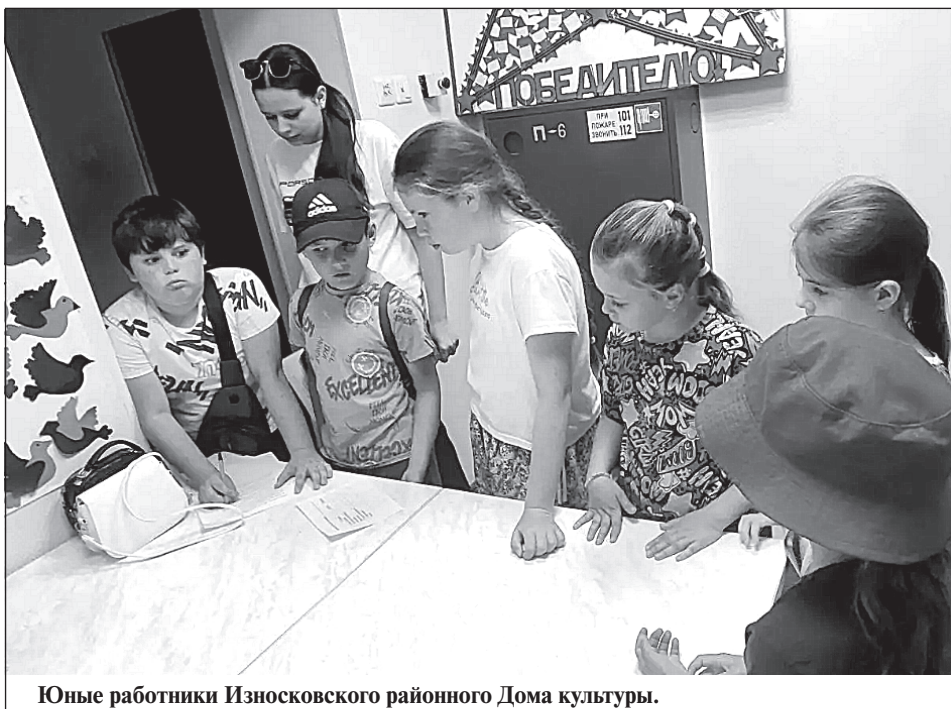
Юные работники Износковского районного Дома культуры.