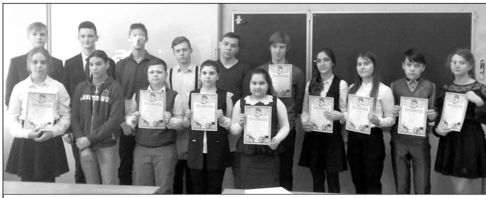
Все участники районного конкурса «Спикеры».