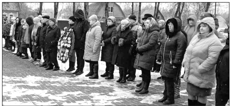
Участники митинга в сквере имени Героя Советского Союза С.Р. Суворова.