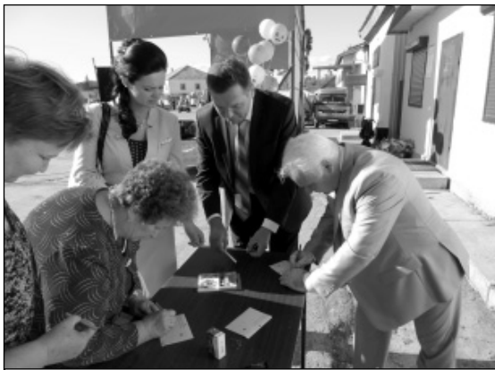
Участники акции «Пожелания любимому району».