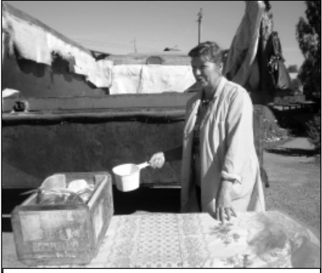
Молоко - это марка СХПК «Холмы».