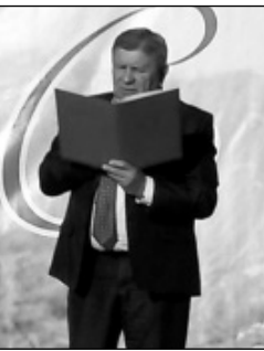
Поздравительный адрес временно исполняющего обязанности губернатора Калужской области А.Д. Артамонова зачитывает заместитель губернатора Ю.С. Кожевников.

Законодательное Собрание Калужской области на юбилее района представляла главный специалист управления по обеспечению деятельности Законодательного