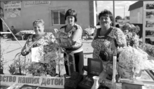
Интересную выставку, рассказывающую об увлечениях местных жителей, подготовили в МО СП «Село Шанский Завод».

Пополнился и список лиц, имеющих звание «Почётный гражданин муниципального