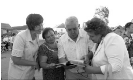
Настоящим событием праздника стала презентация книги «Износки», издание которой было приурочено именно к 30-летию района.