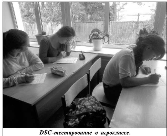
DSC-тестирование в агрокласе.

работы учебного заведения и о дальнейшем развитии колледжа. А 8 октября благодаря администрации МР «Износковский район», отделу сельского хозяйства группа наших ребят совершила поездку в Москву. Учащиеся посетили 17-ю Российскую агропромышленную выставку «Золотая осень-2015», в том числе «Агробизнесфо-