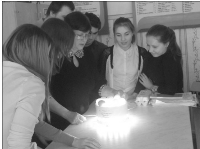
Занятия в аграрном колледже.

рум» и выставку инвестиционных сельскохозяйственных проектов стран БРИКС, которые проходили в МВЦ «Крокус Экспо». Это, несомненно, обогатило ребят новыми знаниями, впечатлениями. Ведь для многих из них просто побывать в столице - уже событие.