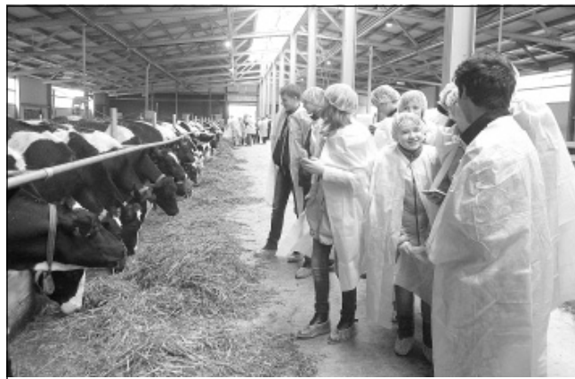
Посещение роботофермы в Мосальске.