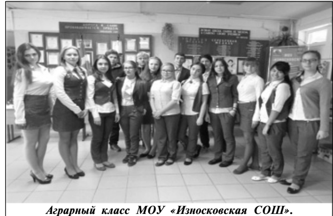
Аграрный класс МОУ «Износковская СОШ».

участие в областном слёте юных экологов и прошли во второй этап конкурса.