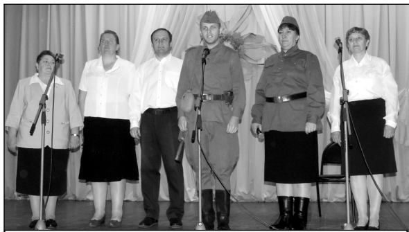
Выступает коллектив Извольской ООШ.

Свою неповторимую окраску получило стихотворение С. Есенина «Письмо к женщине» в прочтении