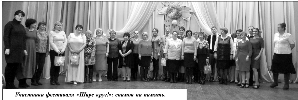
Участники фестиваля «Шире круг!»: снимок на память.

Победители в номинациях муниципального этапа конкурса–фестиваля «Шире круг!» будут представлять Износковский район на областном уровне. Желаем им успеха! Осо-