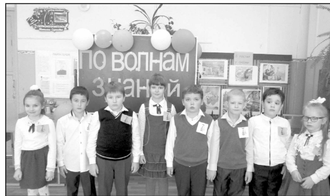
В день посвящения в первоклассники ребята пели песни, читали стихи, играли.

В конце первой четверти у нас прошло торжественное посвящение в первоклассники. Мероприятие назвали «По волнам Знаний». Каждый ученик, получив морскую эмблему, стал юнгой, и, разделившись на три команды, мы поплыли на школьном корабле к неизведанным новым открытиям. Случилось так, что корабль захватили пираты и спрятали все Знания в сундук под пятью замками и хотели заманить на остров Безделья. Чтобы освободить Знания, надо было открыть пять замков.