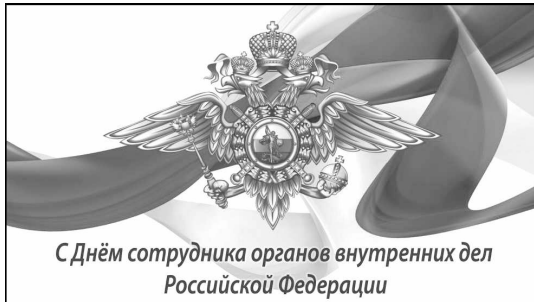
С Днём сотрудника органов внутренних дел Российской Федерации