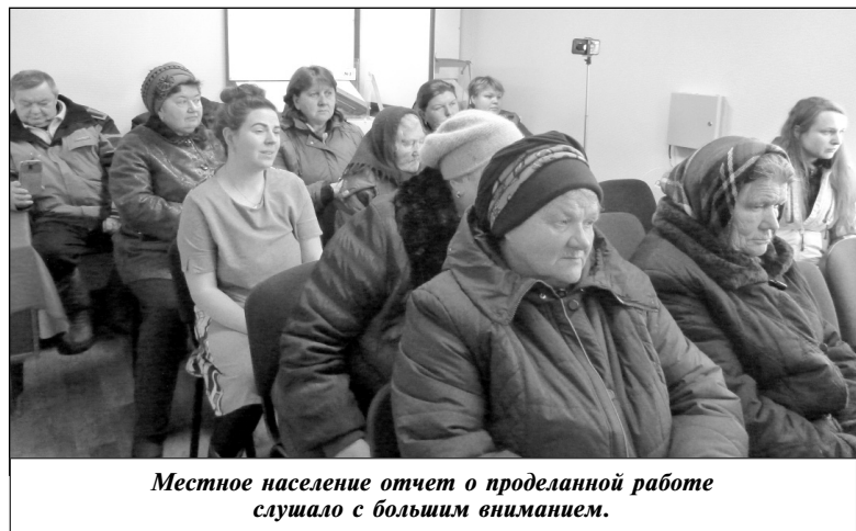
Местное население отчет о проделанной работе слушало с большим вниманием.

земельного налога предприятием ООО «ПрофЗемРесурс», которое начало свою деятельность на территории данного сельского поселения, финансовая ситуация здесь изменилась коренным образом, эффект от предприятия местные жители уже почувствовали.