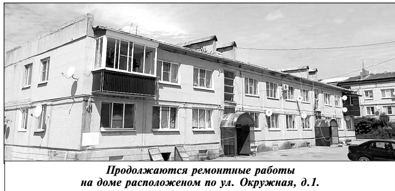
Продолжаются ремонтные работы на доме расположенном по ул. Окружная, д.1.