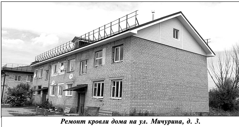
Ремонт кровли дома на ул. Мичурина, д. 3.

Выполняет работы подрядная организация ООО «Стройбыт».