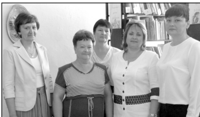
Работники Износковской районной библиотеки.

П. СУСЛОВ, министр культуры Калужской области.