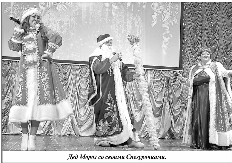
Дед Мороз со своими Снегурочками.