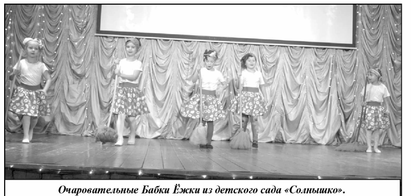
Очаровательные Бабки Ёжки из детского сада «Солнышко».