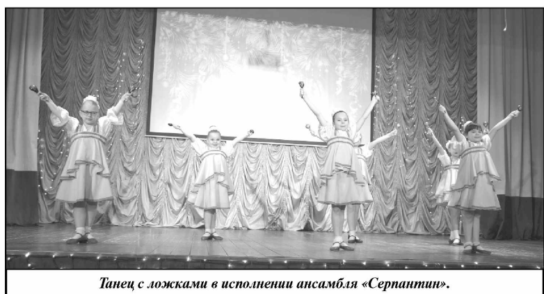
Танец с ложками в исполнении ансамбля «Серпантин».

ящий конкурс, а точнее кастинг на лучшую Снегурочку. Первыми на роль новогодних волшебниц заявили очаровательные Бабки Ёжки из детского сада «Солнышко», исполнив игровой танец и покорилив своим обаянием зрителей. За ними следом заявила и более опытная нечисть: нарядная